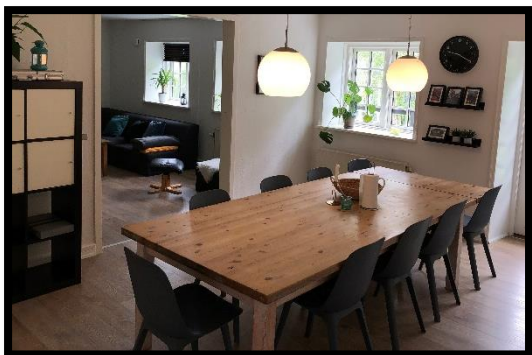
Fællesrum på Godset

Godset er en afdeling med plads til 8 unge i alderen 12-18 år. På Godset er der en fast struktureret hverdag, som fremgår synligt på tavlen i fællesrummet. Hver enkelte ung arbejder med sine individuelle udviklingsmål, der er udarbejdet ud fra kommunens handleplan. Målene justeres løbende på vores behandlingskonferencer. Hver ung får tildelt en primær- og en sekundær pædagog, som vil støtte og hjælpe den unge i dagligdagen via bl.a. daglige samtaler, fastlagte ugesamtaler og forældresamtaler.