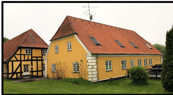
Godset set udefra